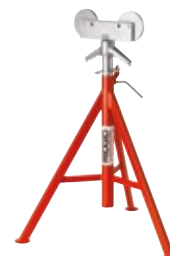
Опоры для труб с роликовыми головками