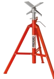
Опоры для труб с V-образными головками